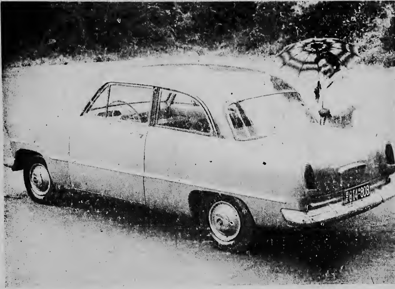
Dit is de FORD TAUNUS 1955, die binnenkort ook op Aruba zal verschijnen. De wagen heeft een 60 P.K. motor, een gesynchroniseerde versnelling en nog vele andere gemakken. De firma NEME in Oranjestad vertegenwoordigt de Ford op Aruba.

De gezaghebber, die van het zondig gebeuren op de hoogte werd gesteld waarschuwde de politie, die de rakkers verdreef.